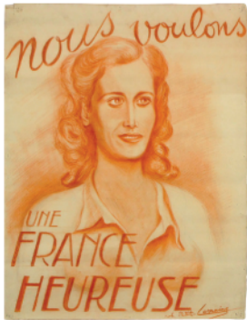
Dessin de «Lorraine»

Du 25 mai au 6 septembre - Musée Vernissage : vendredi 24 mai - 18h30 EXPOSITION TEMPORAIRE